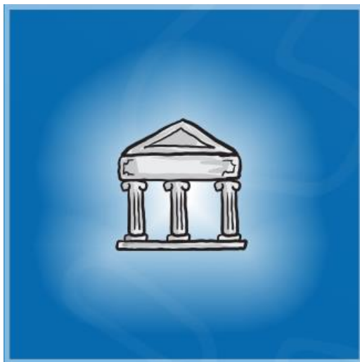
Obrazovanje i obuke

Erasmus+ je program Evropske unije koji obezbeđuje finansiranje projekata za saradnju u tri oblasti: